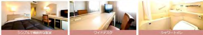
シンプルで機能的な客室