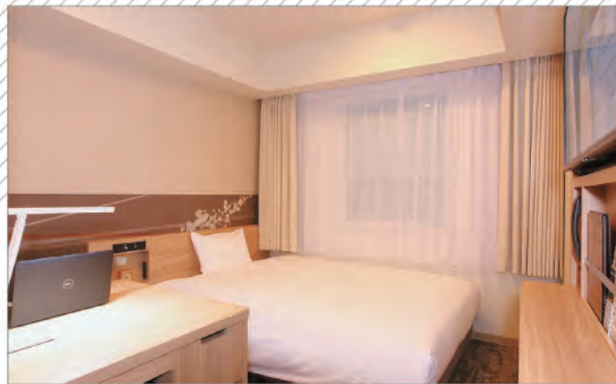
シングルルーム 広さ:13.5㎡~15.2㎡/ベッドサイズ:140cm