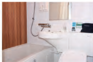
バスルーム (ツインルームのバス・トイレはセパレート)