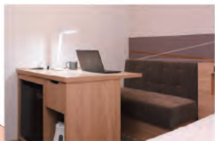
シンプルで機能的な客室 (大きなデスク&ソファ)