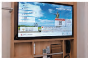
スマートテレビ (各種動画配信対応)