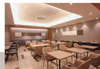
フリースペース & ダイニングスペース