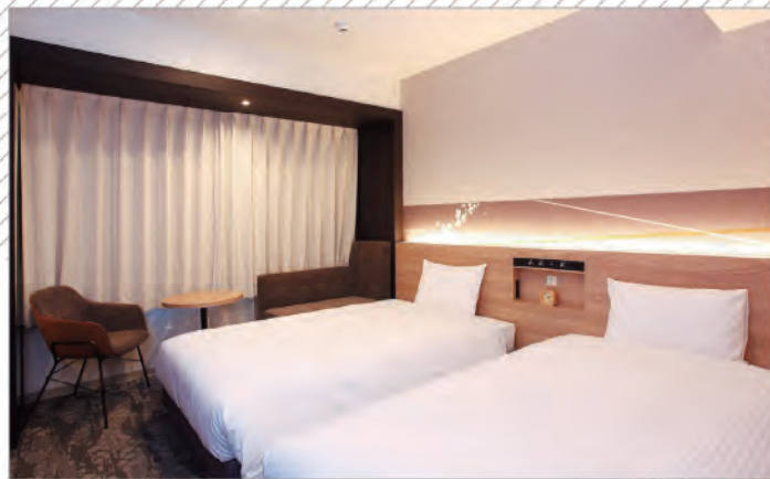
ツインルーム 広さ:20.9㎡~21.8㎡/ベッドサイズ:110cm